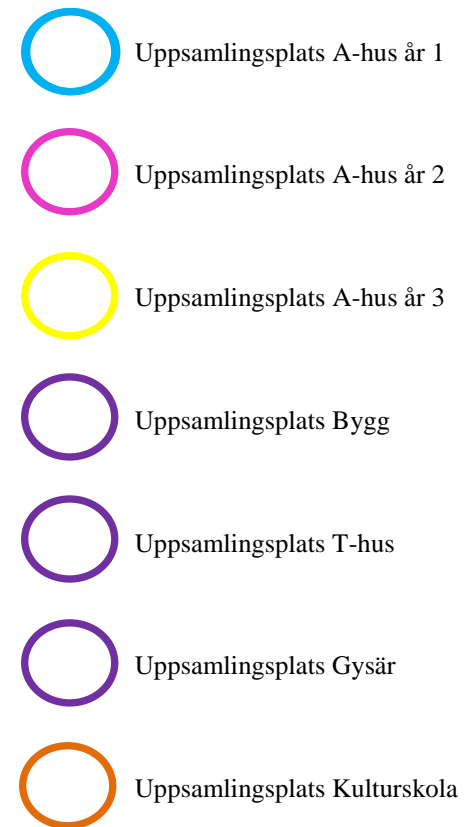
Figur 1: Översikt FIGY